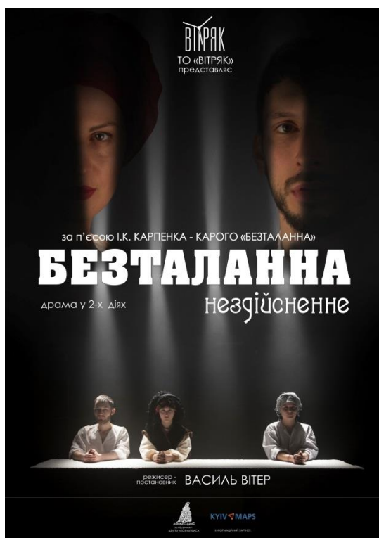
Це афіша попередньої вистави ТО «Вітряк»

Для реалізації проекту будуть задіяні на умовах волонтерської підтримки учасники творчого об'єднання «Вітряк» (студенти, аспіранти та викладачі Інститут екранних мистецтв КНУТКТ імені І.К.Карпенка-Карого). Кількість залучених волонтерів: від 15 до 20 осіб. ГО «СУК» надає для реалізації проекту свою адміністративну базу, офісне приміщення та офісну техніку для проведення адміністративної та звітної діяльності під час реалізації проекту. Оплата керівника ГО «СУК» в проекті - за рахунок власних джерел.