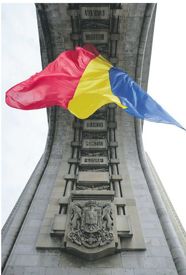
На Бухарестському саміті ухвалено рішення, що Україна (та Грузія) стануть членами НАТО.